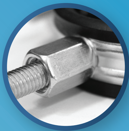
Wysoka nakrętka z podwójnym gwintem