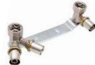
Listwa bateryjna z kolaniem V do cyrkulacji