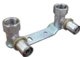
Listwa montażowa bateryjna