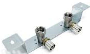
LISTWA BATERyjNA ODSADZONA Z KOLANAMI PRZYŚCIENNymi 16x1/2"