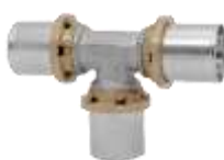
Trójnik prosty i redukcyjny