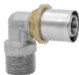
Kolano wkrętne GZ