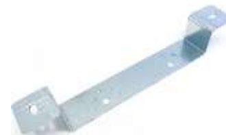
LISTWA MONTAŻOWA BATERyjNA ODSADZONA