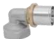
Kolano nakrętne GW