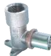
Kolano przyściennne GW