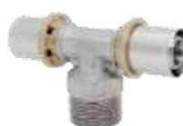
Trójnik wkrętny GZ