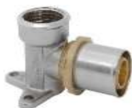
Kolano przyściennne GW, krótkie